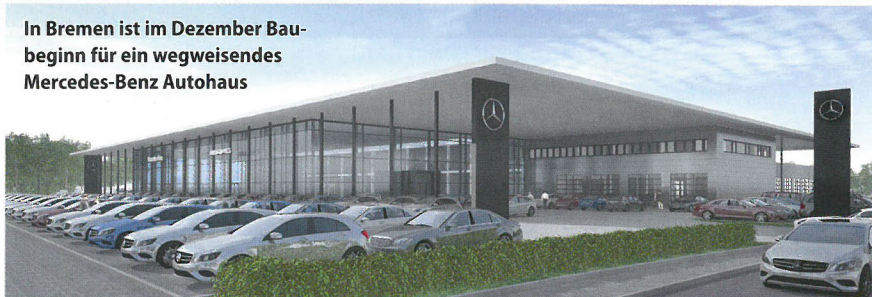
In Bremen ist im Dezember Baubeginn für ein wegweisendes Mercedes-Benz Autohaus

Von Anfang an stand bei diesem Projekt der Mercedes-Benz Kunde im Mittelpunkt. Aus diesem Blickwinkel heraus werden in Bremen nicht nur neue Ausstellungs-, Auslieferungs- und Serviceannahmekonzepte realisiert, sondern auch die internen Prozesse in neu strukturierten und flexiblen Raumsituationen weiterentwickelt. AH ■