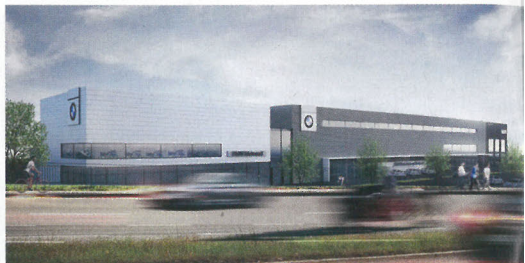
Die neue BMW-Niederlassung in Nürnberg mit über 140 Metern Fassadenlänge wird in drei Hauptbaukörper gegliedert sein.

Für die Planung der neuen Niederlassung zeichnete den Angaben zufolge das Bremer Architekturbüro Beichler + Rohr verantwortlich. In kompakter Bauweise, gegliedert in drei Hauptbaukörper, sollen die Markenwelten auf über 140 Meter Fassadenlänge präsentiert werden.