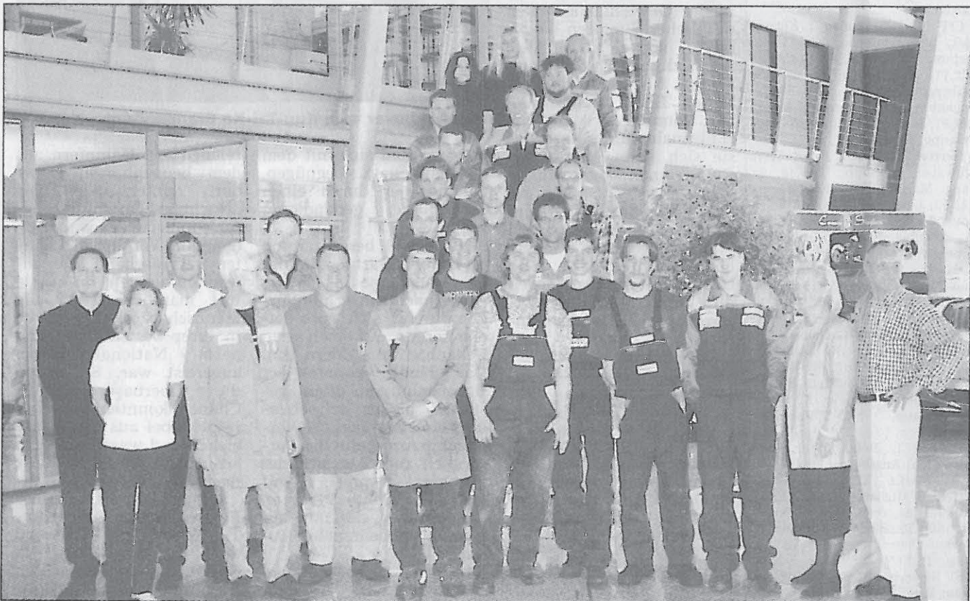
Das Team des Autohauses Wendelstein.